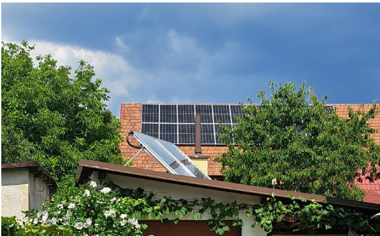
....panely k fotovoltaické elektrárně 10 kW...