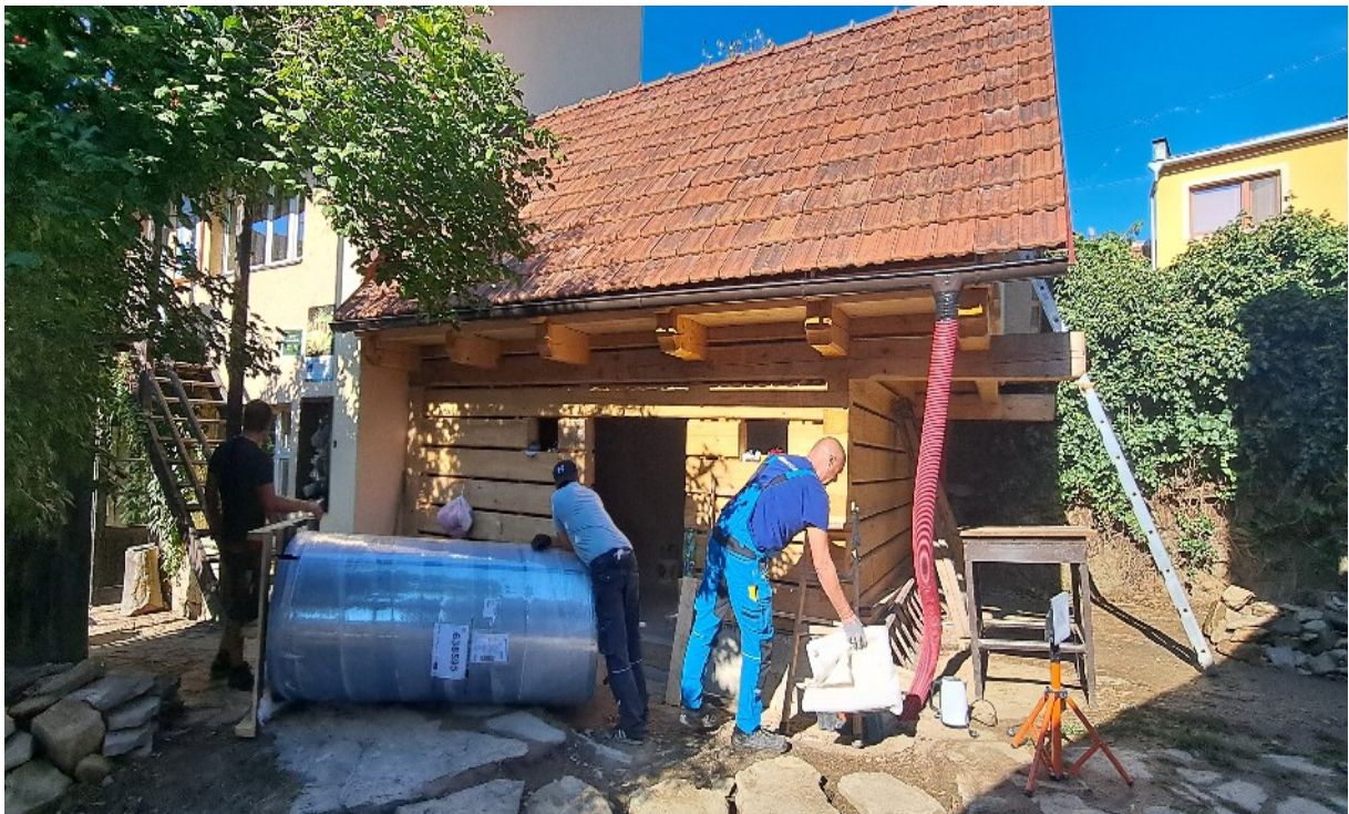
...Instalace akumulačních nádrží...